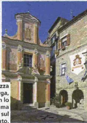
La piazza di Seborga, con lo stemma statale sul selciato.

dadi Liebig o alla cioccolata Milka. Per un tuffo nel passato. Info: www.museo-dellafigurina.it .