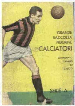
Sopra e a destra, due "storiche" figurine del Museo di Modena.