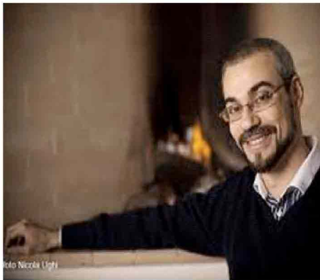
di Antonio Prudeniano