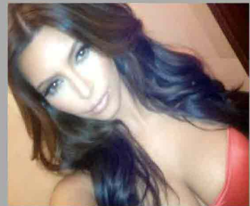
Kim Kardashian mostra il suo nuovo taglio di capelli su