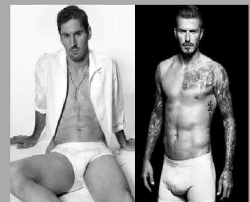
Leo Messi sfida David Beckham e si mette in mutande per D&G...