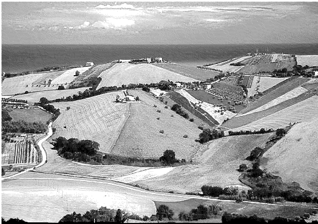
TURISMO DI "MARCA" Le belle colline marchigiane, da scoprire ed amare... all'Infinito