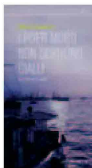
BJORN LARSSON I poeti morti non scrivono gialli Iperborea, 2011 pp. 360, euro 17,00