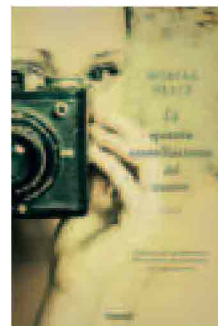
MONICA PEETZ La quinta costellazione del cuore Garzanti, 2012 pp. 304, euro 16,40

E anche nel romanzo della Agus troviamo la volontà di cambiare perché i personaggi per vivere nuove emozioni, per ricercare l'amore la felicità a cui tutti aspiriamo, si scambiano addirittura gli appartamenti in un turbinio incalzante.