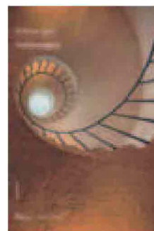
MILENA AGUS Sottosopra Notte tempo, 2012 pp. 174, euro 14,50