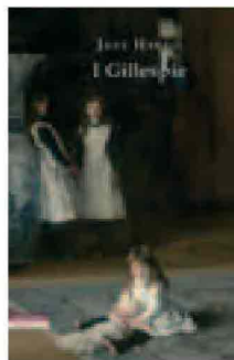
JANE HARRIS I Gillespie Neri Pozza, 2012 pp. 512, euro 18,00