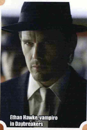
Ethan Hawke, vampiro in Daybreakers