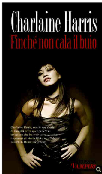
La copertina di Finché non cala il buio , di Charlaine Harris