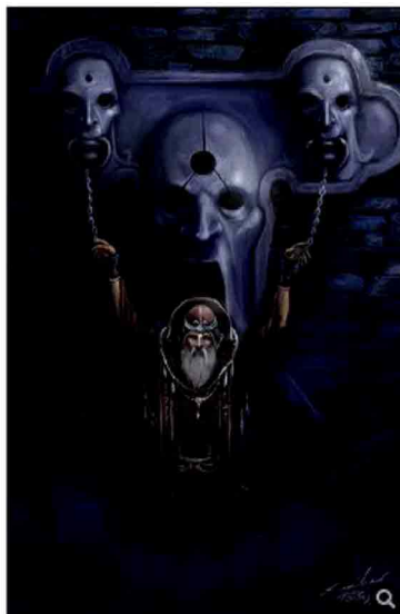
Illustrazione di Estasia — Nemesi

Se Baccalario è ormai da tempo una certezza, come conferma Il popolo di Tarkaan , non può che far piacere vedere che anche Falconi, che con Nemesi chiude la trilogia di Estasia , continui ad affascinare i lettori con opere mature e intriganti.