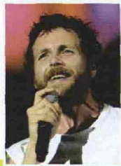
Sopra, Jovanotti: a Ferrara l'1 ottobre.