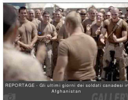
REPORTAGE - Gli ultimi giorni dei soldati canadesi in Afghanistan