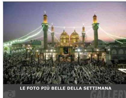
LE FOTO PIÙ BELLE DELLA SETTIMANA