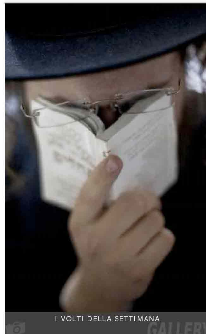
I VOLTI DELLA SETTIMANA