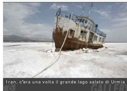
Iran, c'era una volta il grande lago salato di Urmia