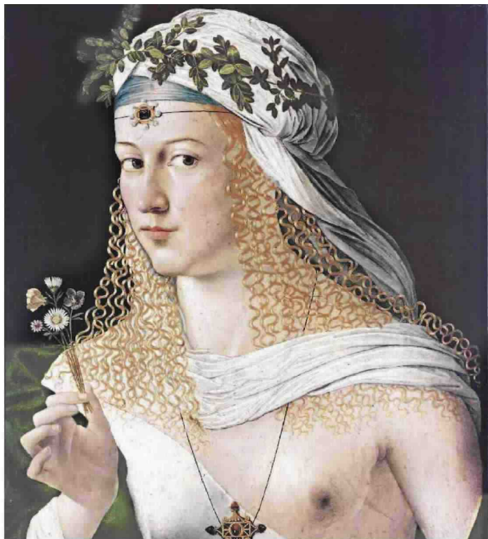
Lucrezia Borgia ritratta da Bartolomeo Veneto

Rinascimento. «Il genio e il potere dai Medici ai Borgia» Mondadori Electa pp. 145, € 29,90