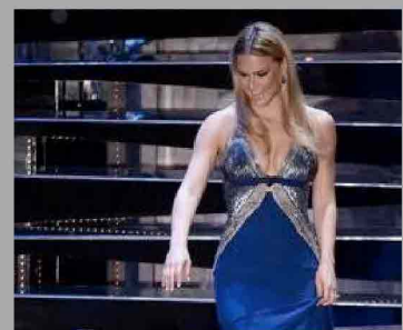
Sanremo/ Bar Refaeli incanta il festival. Duetto storico Littizz...