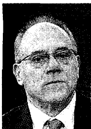
Carlo Verdone, nato a Roma nel 1950

pubblico non vede quest'uomo triste quando è solo, quando piange e si disperà». Niente meglio della vecchia canzone (hit parade 1963) di Neil Sedaka rende il senso recondito delle memorie di Carlo Verdone già schizzate in una settimana ai vertici della classifica. Perché è ovviamente un libro che fa ridere. Con sketch come quello dello zio epilettico che si tuffa sulla tavola imbandita al matrimonio dei genitori di Verdone e manda all'aria l'allestimento nuziale. O quello della giovane cameriera che si lascia rimirare in cima alla scala, stile la Laura Antonelli di Malizia , dal tredicenne Carlo e poi gli regala anche i suoi slip.