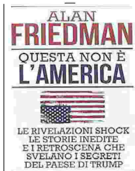
Il libro di A. Friedman