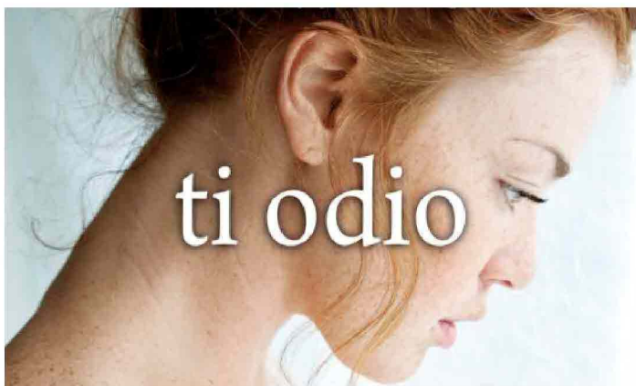
Niamh Greene, Ti amo, ti odio, mi manchi , particolare della cover - Credits: Newton Compton