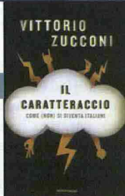
IL CARATTERACCIO. COME (NON) SI DIVENTA ITALIANI di V. Zucconi, Mondadori, pp. 250, € 18,50